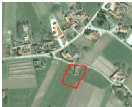
Slika 4: Parcele namijenjene za izgradnju vrtića