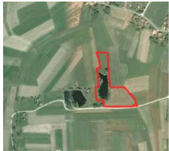
Slika 5: Rekreacijska zona „Dalmatinka“

Rekreacijska zona „Dalmatinka“ obuhvaća k. č. br. 3870, 3871, 3857 i 3856. Čestice obuhvaćaju vodenu površinu nastalu iskopom šljunka i dvije zapuštene poljoprivredne parcele.