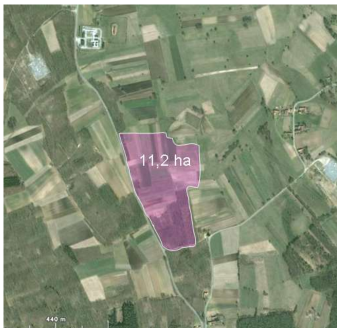
Slika 2: Obuhvat planirane obrtničke zone "Medvedička"