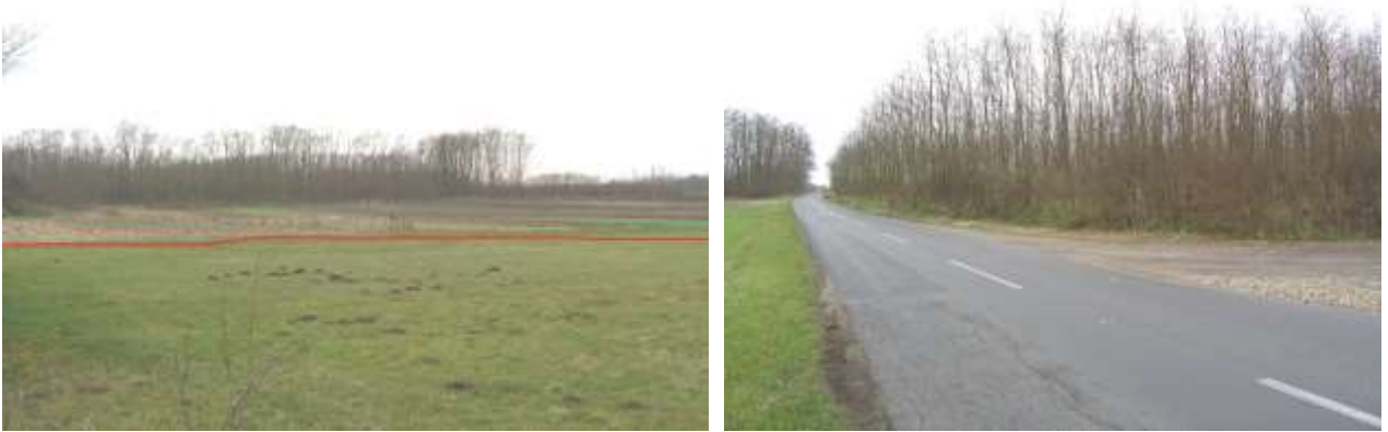
Slika 3: Područje planirane zone (pogled s jugozapada i jugoistoka)

U Novom Virju (Medvedička) planira se obrtnička zona. Zona je smještena uz županijsku cestu ŽC 2184, 1,8 km sjeverno od budućeg čvorišta Đurđevac 2 Podravske brze ceste.