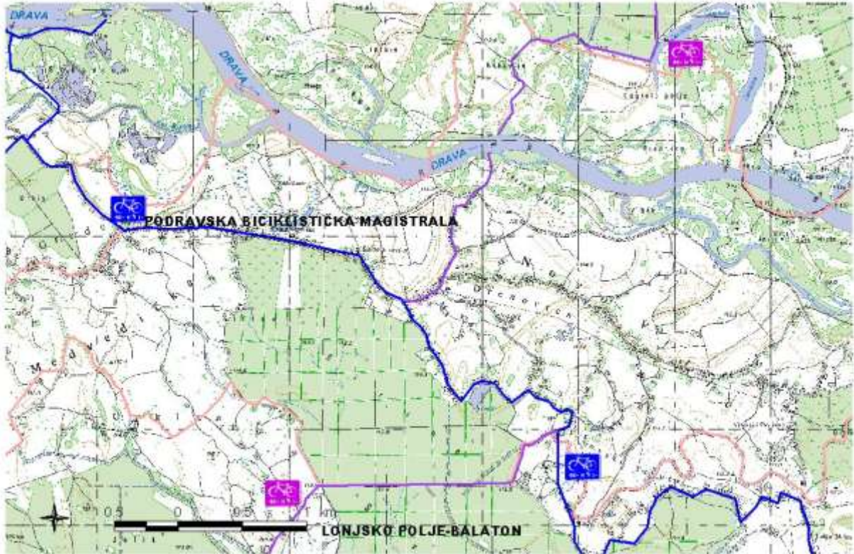
Slika 6: Bicičističke staze